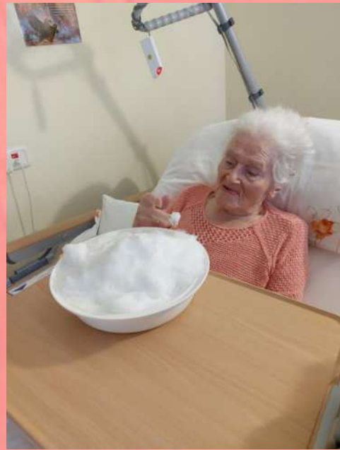
Der erste Schnee. Dieser wurde auch, zur Freude unsere Bettlägerigen, direkt ins Zimmer geliefert.