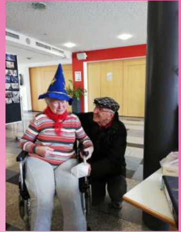
Da hielt keine Krawatte mehr stand. Die Beute war gemacht.