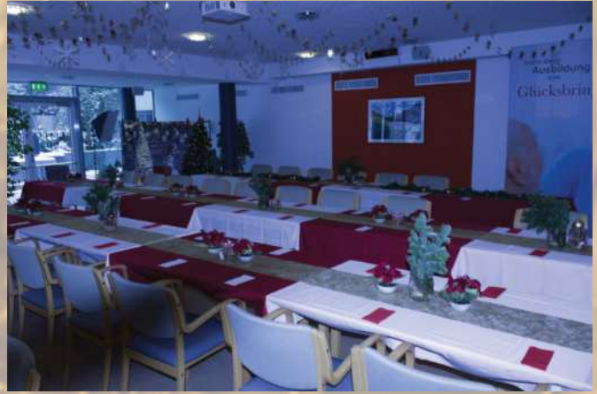
Die letzten Vorbereitungen für das Wunschbaumweihnachtsfest.