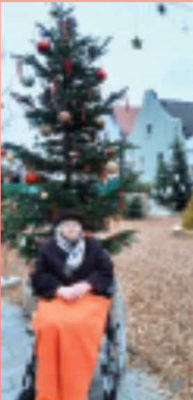
Nach den vielen Weihnachtsvorbereitungen ein kleiner Ausflug zum Durchatmen in die Stadt