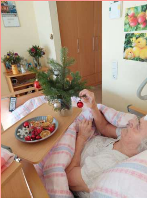
Beim Dekorieren half jeder mit so gut es möglich war.