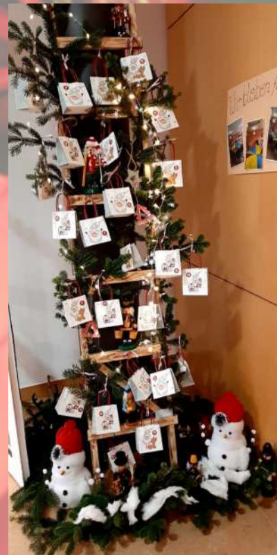
Natürlich durfte auch der Adventskalender nicht fehlen.