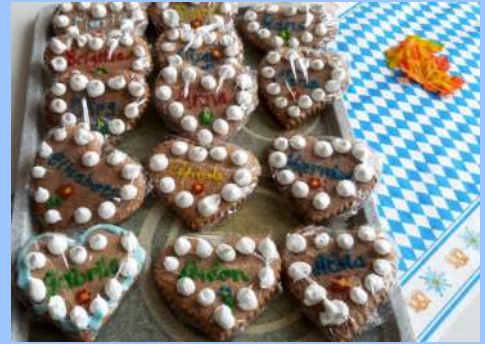
Kirta-Vorbereitungen auf allen Wohnbereichen