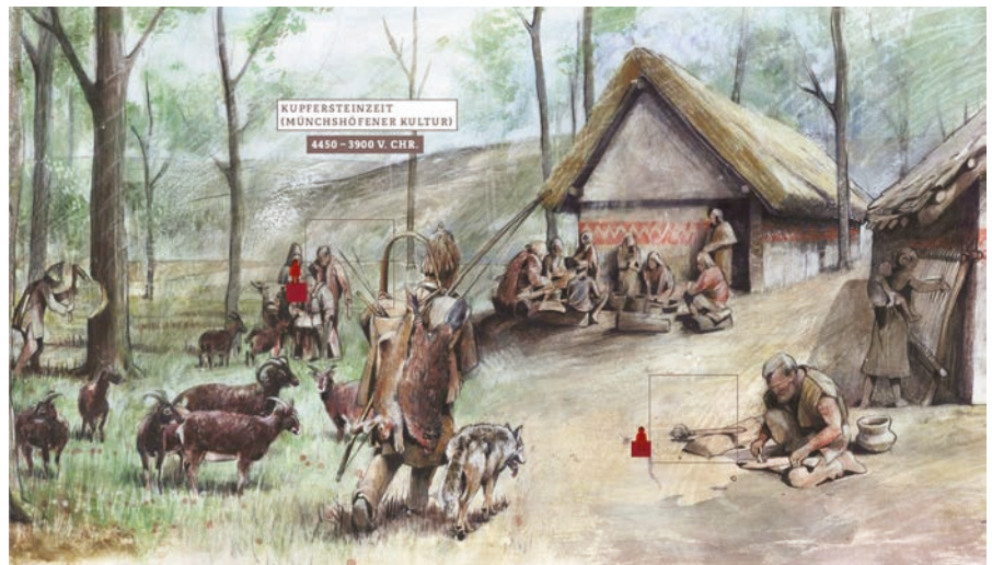
Die Siedlung an der Frontenhausener Straße im Jahr 4318 v. Chr.

Anders als bisher widmet sich die Ausstellung in größerem Maße der kupfersteinzeitlichen (ca. 4300 v. Chr.) Siedlung an der Frontenhaus-