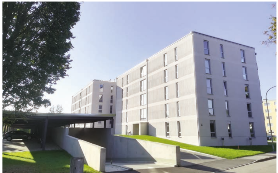
Gebäude A und B mit Garageneinfahrt und Carportstellplätzen

In den beiden Wohnhäusern befinden sich insgesamt 50 neue Wohnungen, die seit diesem Sommer nach und nach bezogen wurden. Die zwei Ein-Zimmer, 28 Zwei-Zimmer, 18 Drei-Zimmer und zwei Vier-Zimmer Wohnungen erstrecken sich auf fünf Etagen und sind allesamt barrierefrei durch einen Aufzug erreichbar. Hinzu kommt, dass einige Wohnungen auch behindertengerecht gebaut wurden. Für die Kraftfahrzeuge der Mieter und Besucher stehen 43 Tiefgaragenplätze und 40 oberirdische Stellplätze zur Verfügung. Die beiden Wohnhäuser verfügen über modernste Technik und die neuesten Energiestandards. Durch den ebenfalls neu entstande-