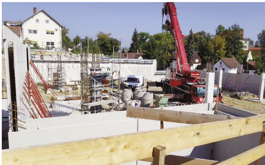
Rege Bautätigkeit am Kirchplatz in Teisbach – seit Mitte Juli laufen unter Hochdruck die Rohbauarbeiten

Seit Mitte Juli laufen unter Hochdruck die Rohbauarbeiten. Fundamente, Stützen, Außenwände und Unterzüge sind weitgehend fertiggestellt. Derzeit ist die Baufirma mit der Herstellung der Deckenplatte beschäftigt. Ab Mitte November stehen die Rohbauarbeiten für die darüber befindliche Kindertagesstätte an. Diese sollen mit den Abdichtungsarbeiten weitgehend 2018 abgeschlossen werden, damit im neuen Jahr bereits mit den Installationsarbeiten begonnen werden kann. Bis Ende 2019 werden beim Gebäudekomplex Tiefgarage und Kindertagesstätte alle Fassaden- und