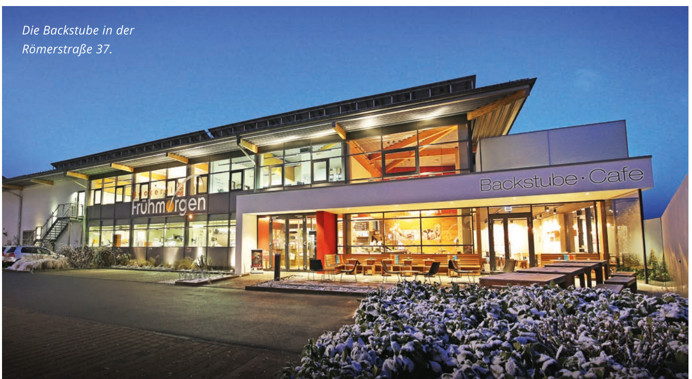
Die Backstube in der Römerstraße 37.

Eine jahrelang gepflegte Tradition und das Beste von Mutter Natur sind die Grundlage der täglichen Arbeit bei der Bäckerei Frühmorgen. So sorgen jeden Tag bereits frühmorgens viele fleißige Hände dafür, dass Sie frische Brezen, Schusterbuben, Maxis, Kerndl Maxis, Brot, verführerische Kuchen und vieles mehr für Ihr Frühstück, einen leckeren Snack für zwischendurch oder zum Kaffee genießen können.